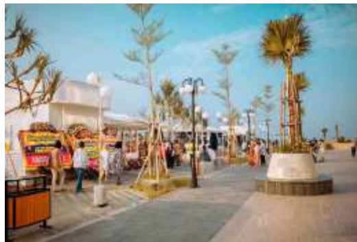
Gambar 2 : Ketersediaan ruang terbuka yang luas

Hasil analisis menunjukkan bahwa kawasan PIK memiliki arus pengunjung harian yang masif dan infrastruktur pedestrian yang sangat memadai. Namun, dominasi aktivitas komersial belum diimbangi dengan ruang berekspresi budaya lokal. Untuk mengatasi hal ini, strategi difokuskan pada pemanfaatan open space (ruang terbuka) seperti plaza atau area komunal yang diubah fungsi sementara menjadi ruang interaksi sosial dan pertunjukan, tanpa harus mengganggu fungsi komersial utama kawasan tersebut.