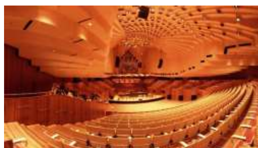
Gambar 3 : Interior Gedung Pertunjukan

strategi penyediaan fasilitas yang adaptif dan inklusif. Penyediaan ruang pagelaran seni tidak selalu memerlukan pembangunan gedung kesenian baru yang tertutup dan kaku. Penelitian ini merumuskan penerapan placemaking menggunakan panggung semi-permanen ( knock-down ) atau pemanfaatan tata ruang jalanan berdesain modern. Interaksi visual secara langsung antara pengunjung yang sedang bersantai (misalnya di area kafe) dengan panggung terbuka ini menciptakan inklusivitas, di mana masyarakat dapat terpapar atraksi budaya tanpa memerlukan upaya atau merasa terintimidasi.