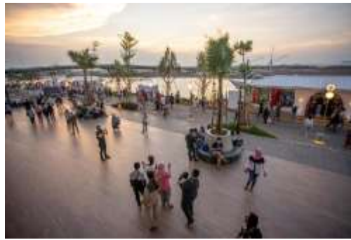
Gambar 1 : Tingginya arus pengunjung dan aktivitas gaya hidup di kawasan komersial Pantai Indah Kapuk. Sumber : agendaindonesia.com [6]

Hasil analisis menunjukkan bahwa kawasan PIK memiliki arus pengunjung harian yang masif dan infrastruktur pedestrian yang sangat memadai. Namun, dominasi aktivitas komersial belum diimbangi dengan ruang berekspresi budaya lokal. Untuk mengatasi hal ini, strategi difokuskan pada pemanfaatan open space (ruang terbuka) seperti plaza atau area komunal yang diubah fungsi sementara menjadi ruang interaksi sosial dan pertunjukan, tanpa harus mengganggu fungsi komersial utama kawasan tersebut.