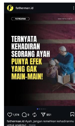
Gambar 3. Postingan Akun @fatherman.id Tanggal 27 Mei 2025

Konten ini menampilkan pesan “Ternyata kehadiran seorang ayah punya efek yang gak main-main!”, disertai visual seorang ayah dan anak yang sedang berinteraksi dalam konteks religius. Pesan ini menekankan pentingnya kehadiran dan tanggung jawab ayah dalam proses tumbuh kembang anak, baik secara emosional maupun spiritual. Responsibility juga mencakup kehadiran ayah dalam pengambilan keputusan penting, pendidikan, dan kesejahteraan emosional anak