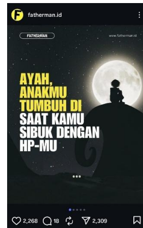
Gambar 1. Postingan Akun @fatherman.id Tanggal 1 Mei 2025

Postingan ini memiliki pesan yang emosional karena seolah membuat perasaan bersalah dan refleksi diri pada ayah yang terlalu fokus pada handphone . Secara visual dan verbal, pesan ini mengandung ajakan ( call to action ) supaya ayah dapat lebih hadir secara utuh dalam kehidupan anak. Postingan ini juga bertujuan untuk meningkatkan kesadaran atau awareness tentang bahaya fatherless secara emosional, dimana ketika ayah hadir secara fisik tetapi tidak terlibat secara emosional atau komunikasi akibat terlalu fokus dengan teknologi. Maka dari itu, konten ini relevan dengan misi akun @fatherman.id , yakni mengedukasi masyarakat tentang pentingnya peran ayah dalam pengasuhan anak.